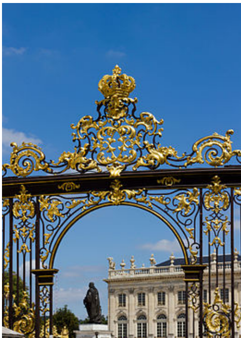
[Porte de la place de Nancy]