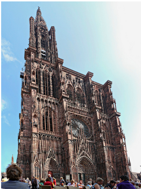
[Cathédrale de Strasbourg]